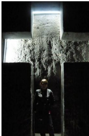
Plaza Sto. Domingo, Cartagena de Indias