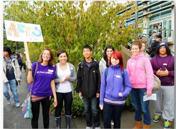
Lider de Orientaciones