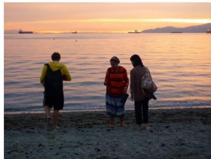
Playas de UBC