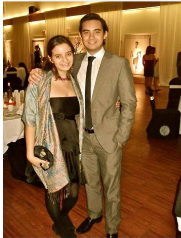
Representando a la Asociación de Estudiantes Internacionales