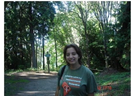
Bosques de UBC