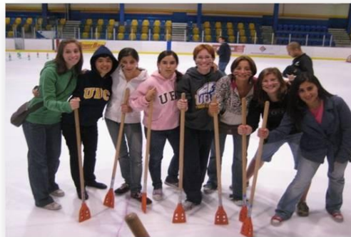
En la pista de patinaje de UBC